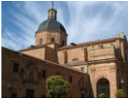
Iglesia de la Purísima