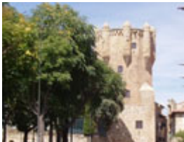
Torre del Clavero