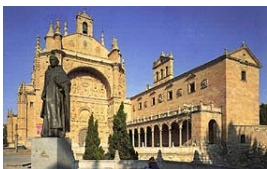
Convento de San Esteban (PP. Dominicos)

Horario: Todos los días de 10:00 a 19:15.