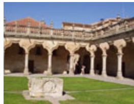
Universidad - Patio de Escuelas Menores

La más antigua de España y uno de los monumentos más representativos del plateresco español.